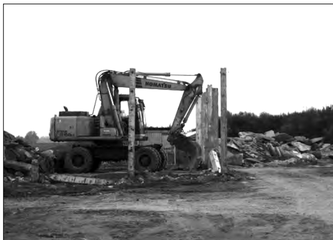
die alte Schweinemast war ein Wildbienenrefugium

Gut 20 Jahre nach dem Mauerfall wurden bis zu 80% der Bienenvölker mancher Gegend vernichtet.